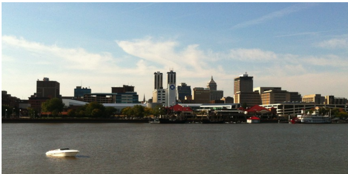
Peoria Riverfront – typický obrázek města.

Hlavní je ale byznys – proto tu všichni jsme. Peoria, ač město uprostřed polí, je sídlem hned několika významných firem, z nichž dominantní je Caterpillar, cílová stanice velké části studentů MBA, včetně několika Čechů. Dalšími významnými zaměstnavateli jsou například velice významná nemocnice OSF, Jump Trading Simulation & Education Center anebo Bosch. Amerika je v první řadě země příležitostí, to jsem zjistil velice záhy. Vy dostanete celé dva roky, abyste je využili. Navíc na studentské vízum můžete pracovat až jeden rok zcela bezproblémově. Pokud chcete zůstat déle, musí vás zaměstnavatel sponzorovat, ale na to se už musíte osvědčit.